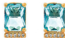
28 - Brinco Retangular Cravejado Dourado 16 mm | B20048 59,99