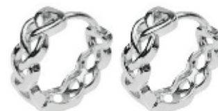
51 - Mini Argola Trançada Prateado 10 mm | B20020 39,99