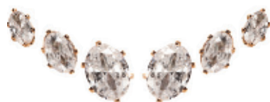
6 - Brinco Trio Zircônia Oval Dourado