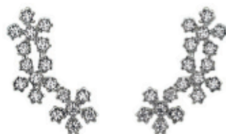
47 - Brinco Flor Cravejada Prateado 16 mm | B20036 59,99