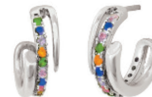
57 - Brinco Argola Cravejada Colorida Prateado 10 mm | B20026 59,99