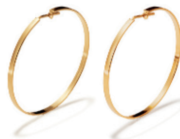
33 - Brinco Argola Dourado 40 mm | B20007 44,99