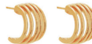
21 - Argolinha Cinco Fios Dourado