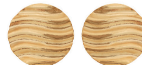
40 - Brinco Redondo Textura Dourado 29 mm | B20047 59,99