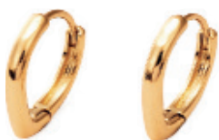
5 - Brinco Mini Argola Lisa Dourado