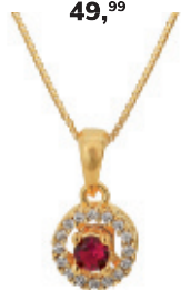
3 - Colar Veneziana Zircônia Rubi Dourado