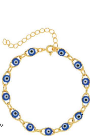
44 - Pulseira Olhos Gregos de Vidro Dourado 22 cm | B20057 44,99