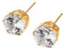
7 - Brinco Ponto de Luz Dourado