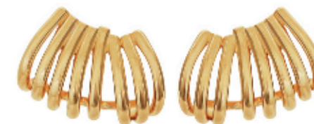
36 - Brinco Oito Fileiras Dourado 21 mm | B20034 69,99