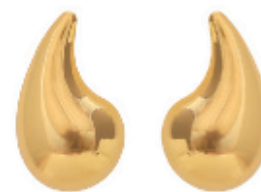
37 - Brinco Vírgula Dourado 27 mm | B20056 49,99