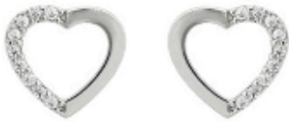
59 - Brinco Coração Cravejado Prateado