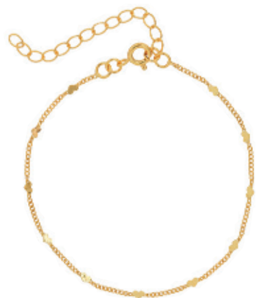
43 - Pulseira Groumet Corações Dourado 22 cm | B20063 24,99