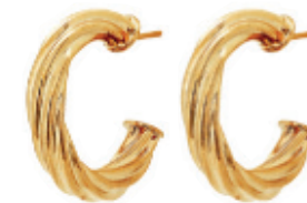
34 - Argola Torcida Dourado 22 mm | B20027 49,99