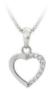
61- Colar Coração Cravejado Prateado