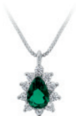
48 - Colar Veneziana Zircônia Esmeralda Prateado 45 cm | B20069 69,99