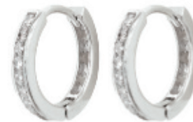
50 - Mini Argola Cravejada Prateado 10 mm | B20023 45,99