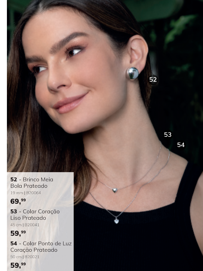
52 - Brinco Meia Bola Prateado 19 mm | B20064 69,99