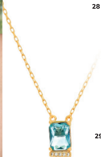
29 - Colar Ponto de Luz Retangular Dourado 50 cm | B20053 69,99