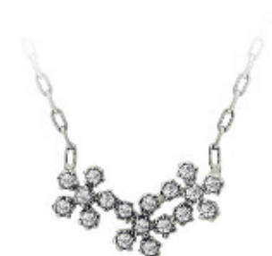
49 - Colar Flor Cravejada Prateado 55 cm | B20042 79,99