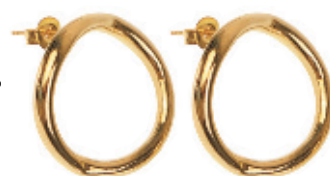
31 - Brinco Aro Dourado 20 mm | B20016 de: 59,99 por: 39,99