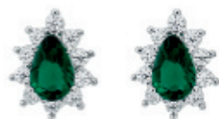
46 - Brinco Gota Zircônia Esmeralda Prateado 10 mm | B20068 59,99