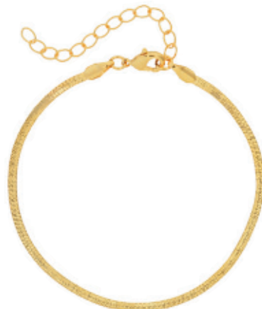
45 - Pulseira Malha Snake Dourado 22 cm | B20058 34,99