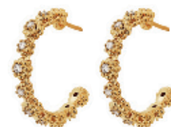
35 - Argola Flores Cravejadas Dourado 20 mm | B20031 49,99