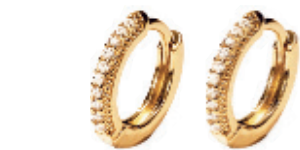
4 - Mini Argola Cravejada Dourado