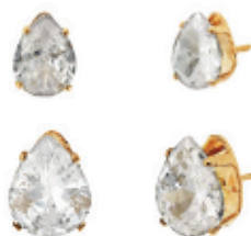
10 - Kit Ponto de Luz Gota Dourado