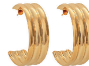
38 - Brinco Argola Ondas Dourado 33 mm | B20055 59,99