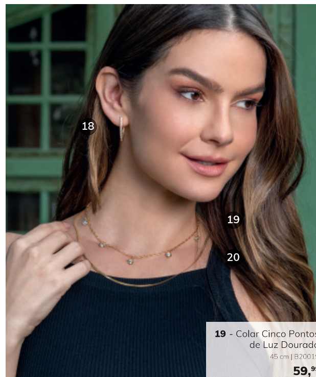
18 - Argola Canoa Cravejada Dourado