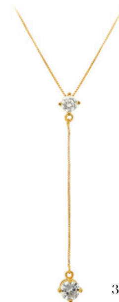
22 - Colar Gravatinha Ponto de Luz Dourado