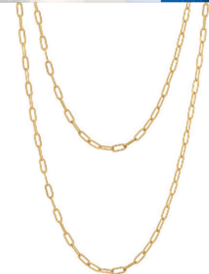
30 - Colar Duplo Corrente Dourado 45 e 55 cm | B20022 69,99