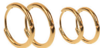
8 - Kit Dois Pares de Argolas Dourado