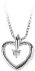
63 - Colar Pingente Coração Prateado