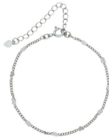
64 - Pulseira Grumet Coração Prateado