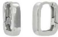
60 - Argola Click Retangular Prateado