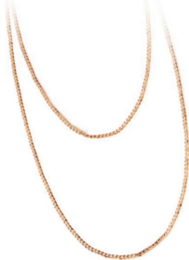
11 - Colar Duplo Dourado