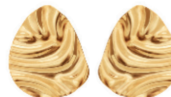
39 - Brinco Orgânico Textura Dourado 25 mm | B20037 59,99