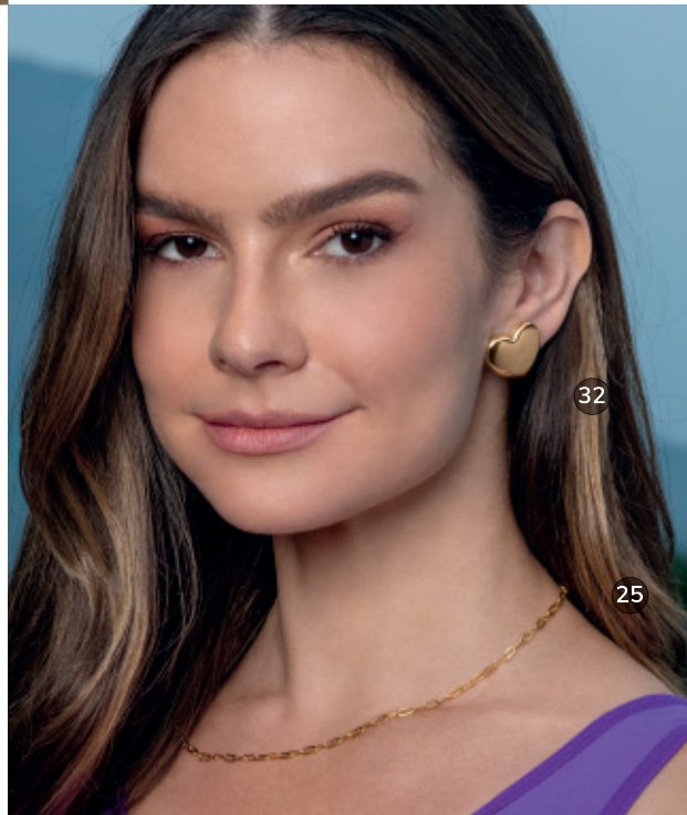
32 - Brinco Coração Abaulado Dourado 23 mm | B20065 59,99