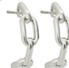
58 - Meia Argola Elos Prateado 20 mm | B20033 de: 59,99 por: 39,99