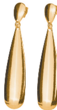
12 - Brinco Gota Dourado