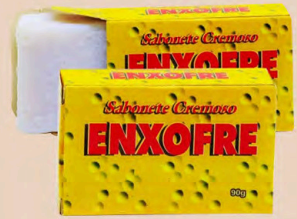
SABONETE CREMOSO ENXOFRE 90g