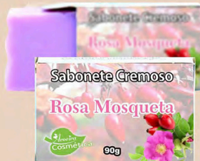
SABONETE CREMOSO ROSA MOSQUETA 90g