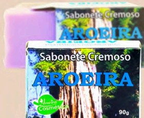
SABONETE CREMOSO AROEIRA 90g