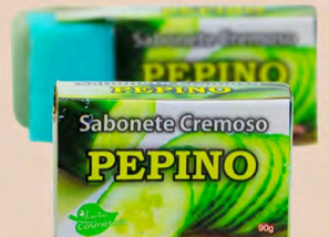
SABONETE CREMOSO PEPINO 90g