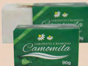
SABONETE CREMOSO CAMOMILA 90g