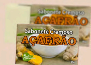
SABONETE CREMOSO AÇAFRÃO 90g