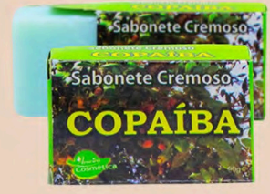
SABONETE CREMOSO COPAÍBA 90g