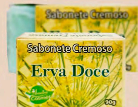
SABONETE CREMOSO ERVA DOCE 90g