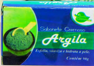
SABONETE CREMOSO ARGILA 90g

Sua limpeza diária da pele ainda mais suave e gostosa.