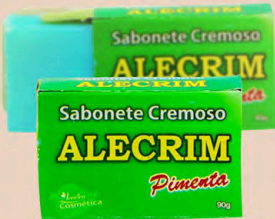
SABONETE CREMOSO ALECRIM PIMENTA 90g