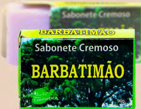
SABONETE CREMOSO BARBATIMÃO 90g