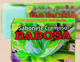
SABONETE CREMOSO BABOSA 90g