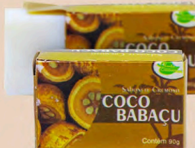
SABONETE CREMOSO COCO BABAÇO 90g