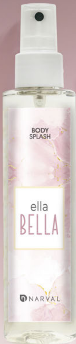
REF. 35086.9 BODY SPLASH ELLA BELLA 150 ml