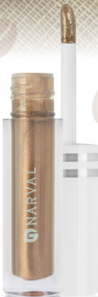
1 - REF. 35039.7 VANILLA COFFEE