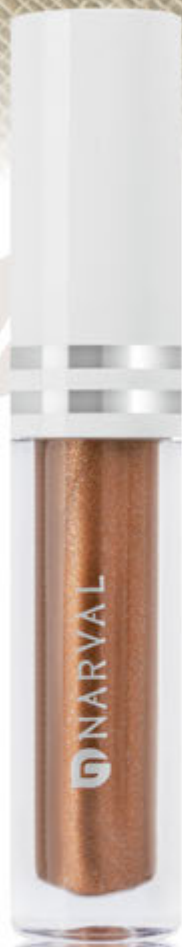
2 - REF. 35038.9 FRAPPUCCINO COCOA