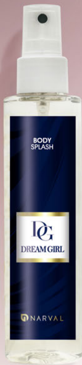
REF. 35088.5 BODY SPLASH DREAM GIRL 150 ml