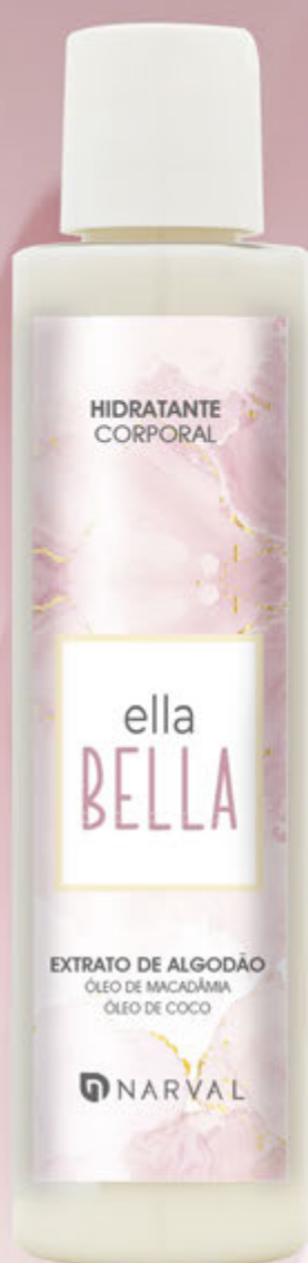
REF. 35071.0 LOÇÃO CORPORAL ELLA BELLA 150 ml