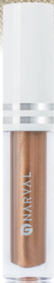
3 - REF. 35040.0 MOCHA COFFEE