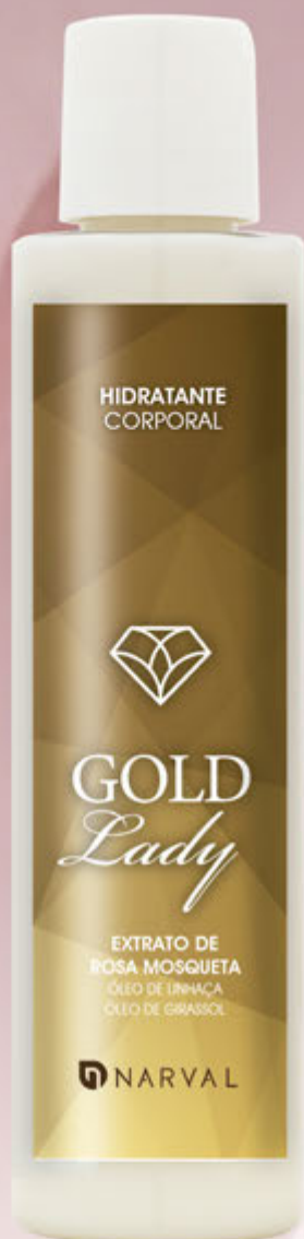
REF. 35072.9 LOÇÃO CORPORAL GOLD LADY 150 ml