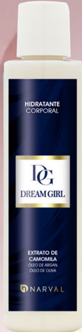
REF. 35073.7 LOÇÃO CORPORAL DREAM GIRL 150 ml