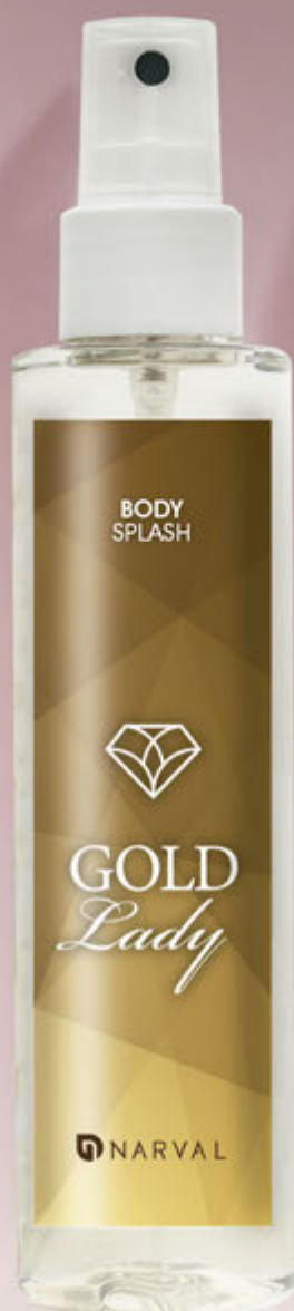
REF. 35087.7 BODY SPLASH GOLD LADY 150 ml